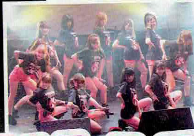
巨乳の女のこを構成されてい る一見トリッキーなアイドルグル ープKNU。巨乳ブーム再燃の火 つけ役となることを務めたい