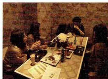
女性陣が常日頃、男性に対していただいている不満が一致し、会話がいつのまにかヒートアップ! 聞き手役の筆者は男性を代表してダメ出しさせていただきました…。

過去を反省してそれを次に生かそうとしている言葉を聞くと、彼が普段見せない弱さを感じ、「私が彼を守る」という母性本能がくすぐられるのです。